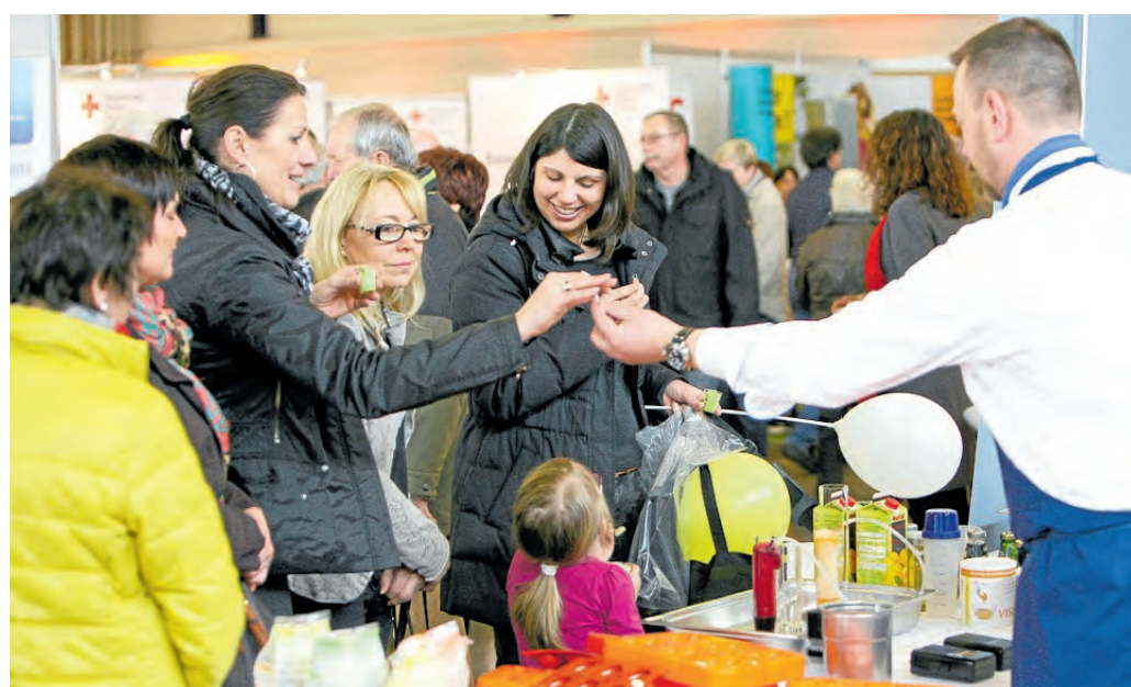
Testen und Ausprobieren gehört ebenfalls zur „fit & gesund“.