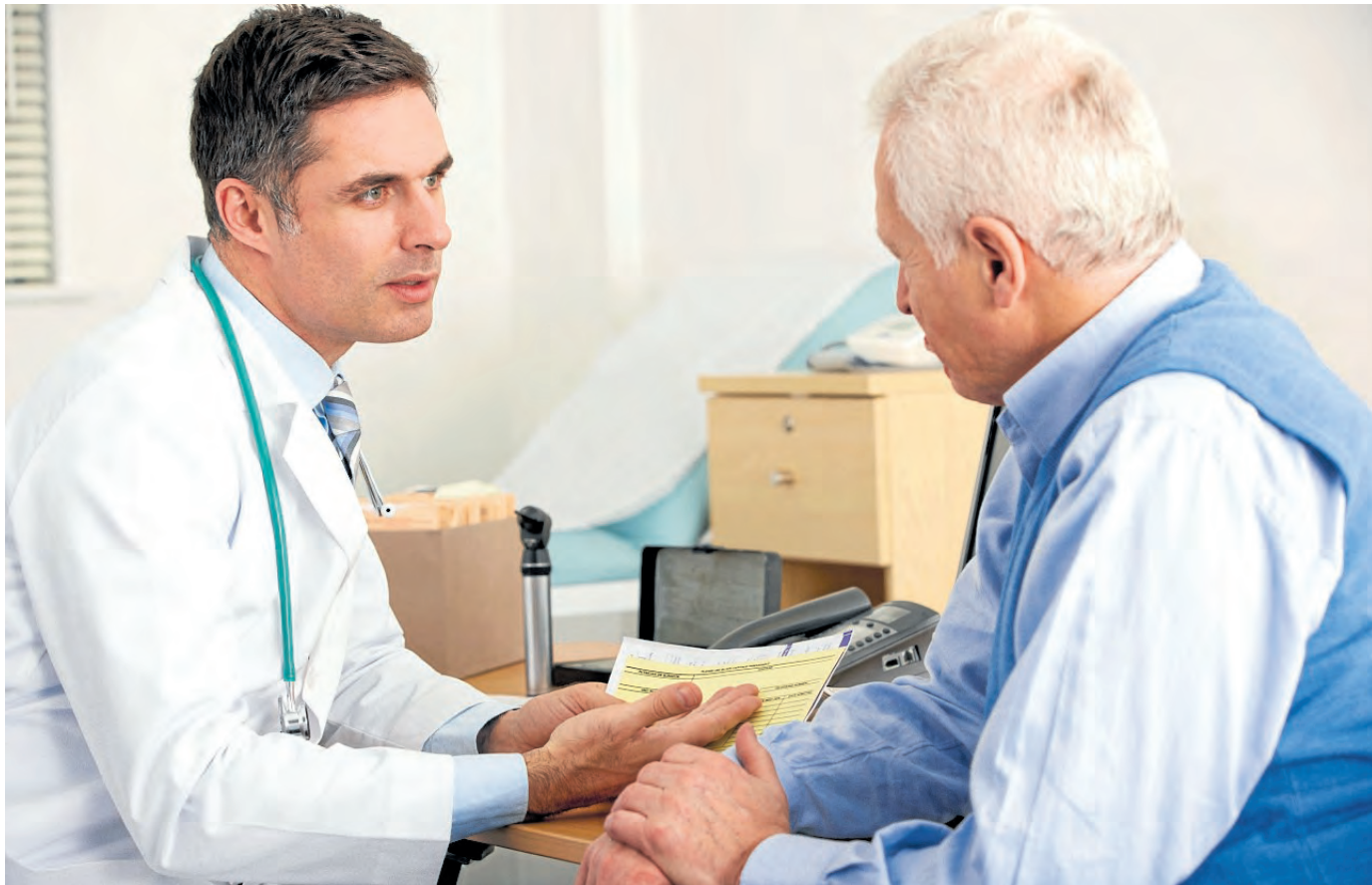
Zum Arzt gehen Männer häufig erst, wenn sie erkrankt sind. Vorsorge kann dem vorbeugen.