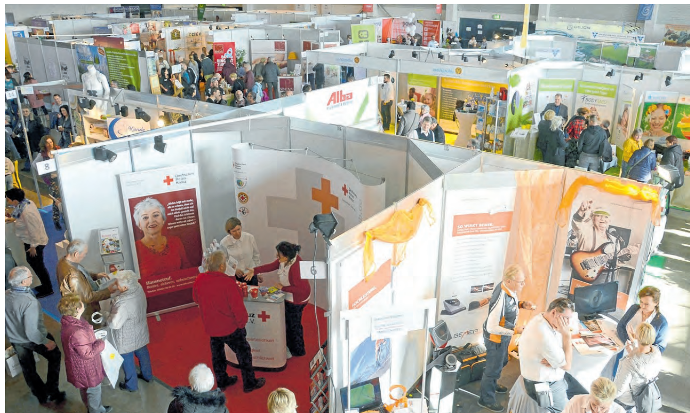
Rund 70 Aussteller sind dieses Jahr auf der Messe „fit & gesund“ vertreten.