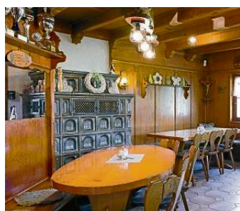
Der gemütliche Gastraum mit Stammtisch und Kaminofen