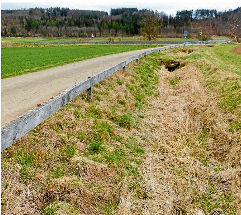
Der Quelltümpel der Bütt nau ist eigentlich gut gefüllt, doch das Bild täuscht; kurz vor der Mündung in die Lauchert ist kein Wasser mehr zu sehen.