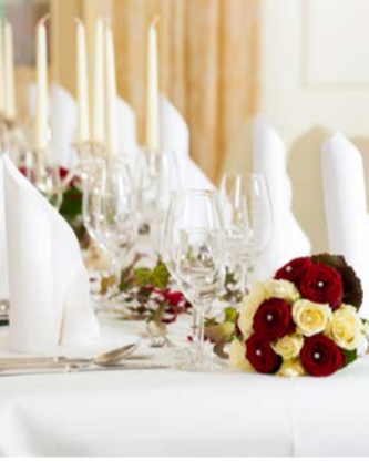
Der passende Feierraum ist wichtig.

Das Hochzeitspaar sollte zum Essen etwas anbieten, das allen Gästen schmeckt, und auch auf mögliche Sonderwünsche achten. Die eventuell gebuchte Band oder Mobildiskotheke sollte man sich schon etwas näher betrachtet haben, denn die Musikgeschmäcker können sehr verschieden sein.