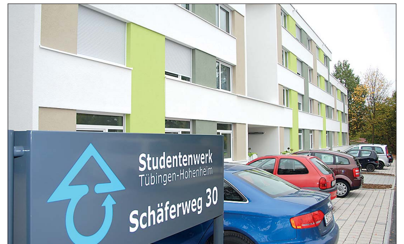
Rechtzeitig zum Vorlesungsbeginn wurde das neue Wohnheim fertig. Die moderne Ausstattung – unter anderem in den WG-Küchen – lädt zum Wohlfühlen ein.

Die Lage im Schäferweg 30 ist ideal, bis zum Campusgelände sind es nur wenige Schritte. Die 77 Wohnheimplätze verteilen sich auf 40 Einzelappartements mit eigenem Bad und Kochnische, zwei rollstuhlgerechte Appartements sowie sieben Wohngemeinschaften mit je fünf Zimmern. Die Baukosten lagen knapp unter den vier Millionen Euro, die vom Studentenwerk veranschlagt worden waren. Das Land Baden-Württemberg steuerte rund 600 000 Euro als Zuschuss bei.